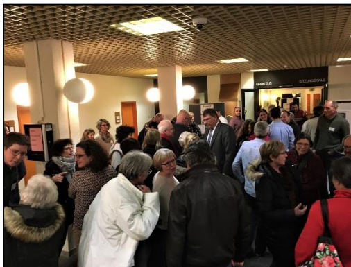
2. Ehrenamt trifft Landratsamt

Der Integrationslotse des Landkreises Dachau hatte am 5. Februar 2020 zur ersten Austausch-Veranstaltung „Ehrenamt trifft Landratsamt“ eingeladen. Das Treffen ermöglichte in einem informellen Rahmen einen Perspektivwechsel zwischen Hauptamt und Ehrenamt. Durch den persönlichen Austausch konnte die Zusammenarbeit zwischen den ehrenamtlich Engagierten aus den Asyl-Helferkreisen und den Mitarbeiterinnen und Mitarbeitern aus dem Bereich Asyl und Integration gestärkt werden.