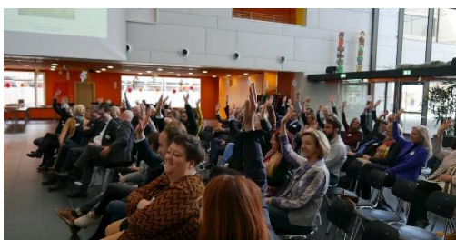
Bildungsakteure im Landkreis Dachau stimmen für die Bewerbung ab.

Am 23. November 2019 fand das zweite Dialogforum in der Dr.-Josef-Schwalber-Realschule in Dachau statt. Dort wurden die bisherigen Ergebnisse aus dem Bewerbungsprozess des Landkreises Dachau um die Qualitätssiegel „Bildungsregion und digitale Bildungsregion in Bayern“ durch Repräsentant*innen der fünf Bildungssäulen sowie der digitalen Bewerbungsaspekte innerhalb eines Podiumsgesprächs präsentiert. Der Bereich