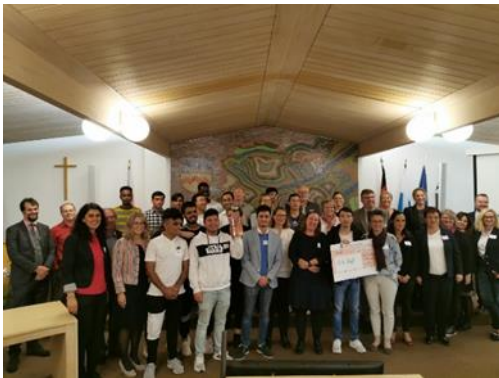
Der "Azubi-Treff" erhielt den mit 500 Euro dotierten Preis des Asyl- und Integrationsbeirates im Landkreis Dachau.

Am 11. Oktober 2019 verlieh der Asyl- und Integrationsbeirat den ersten Integrationspreis im Landkreis Dachau.